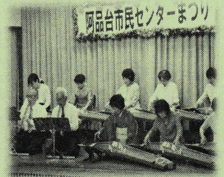
【箏曲クラブ 和みの会】