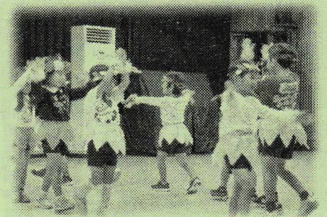
【阿品台東保育園 ダンス】

開会式では、阿品台東保育園の園児の皆さんに出場していただき、センターまつりの開会に花を添えていただきました。音楽に合わせて元気よく踊る園児の姿は、本当にかわいらしかったです。1階のフロアでは、昨年に引き続き、日本赤十字広島看護大学のアロママッサージ部の皆さんによる「足裏マッサージコーナー」を、2階の和室では廿日市西高等学校家庭部の皆さんによる「お茶席」を開催していただき、癒しの空間を演出していただきました。